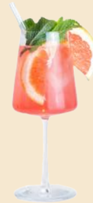
65. SARTI SPRITZ 7,9 Sarti, Prosecco, Su Soda sarti, prosecco, Su soda