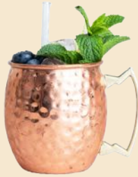
50. BLUE BERRY MULE 9 Blaubeere, Vodka, Ginger Beer 1,2,3 blueberry, vodka, ginger beer 1,2,3