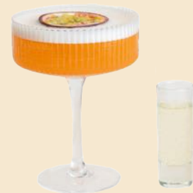
55. PORNSTAR MARTINI 13 Maracuja, 1 Vanille, Vodka, Prosecco Su passion fruit, 1 vanilla, vodka, prosecco Su