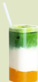
Matcha Latte Mango