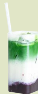
Matcha Latte Blaubeere