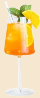
62. APEROL SPRITZ 7,9 Aperol, 1 Prosecco, Su Soda, Orange aperol, 1 prosecco, Su soda, orange