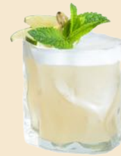
53. GIN UMESHU SOUR 7.5 Gin, Pflaumenwein, Sake, Limette gin, plum wine, sake, lime