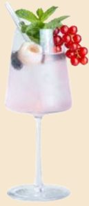
60. LYCHEE SPRITZ 8,5 Lycheelikör, 1,3 Prosecco, Su Limette, Soda lychee liqueur, 1,3 prosecco, Su lemon, soda