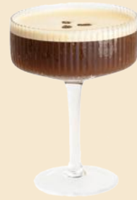
51. COFFEE CLOUD 10 vietn. Kaffee, Vodka, Espresso Martini vietn. coffee, vodka, espresso martini