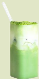
Iced Matcha Latte Vanilla Cloud