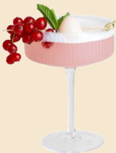
56. LYCHEE MARTINI 10 Lychee, 1,3 Vodka lychee, 1,3 vodka