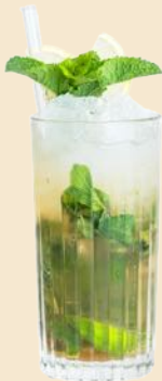
54. YUZU MOJITO 9 Kyoko Yuzu Sake, Rum, Rohrzucker, Minze Kyoko Yuzu sake, rum, cane sugar, mint