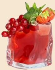
52. CHERRY BLOSSOM 7.5 Cranberrysaft, Junmei Sake, Triple Sec cranberry juice, Junmei sake, Triple Sec