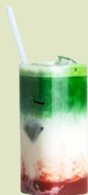
Matcha Latte Erdbeere