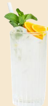
57. JINZU GIN TONIC 7,5 Jinzu Gin, Tonic Water 12 Jinzu gin, tonic water 12